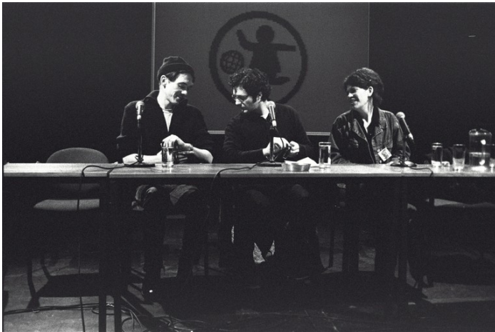
Jan, Sprij: Nettime . READ ME! Präsentation auf dem DEAF98 , 1998, Fotografie

der Hauptziele bestand darin, eine aus der Perspektive der sogenannten Netizens formulierte Netzkritik zu etablieren, die sich gegen bestehende Strukturen und kapitalistische Entwicklungen im Kontext des Internets richtete. 9 Im Jahre 1998 präsentierten die Nettimers auf dem DEAF98 , einem niederländischen Festival für elektronische Kunst, eine Art Manifest. 10