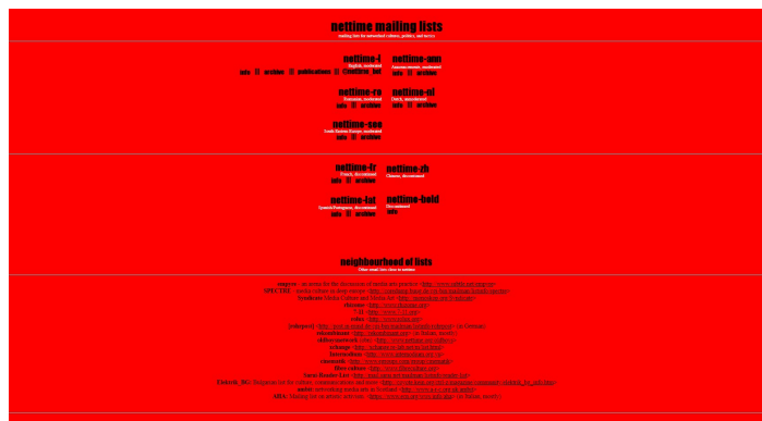
Nettime-Archiv, Screenshot der Webseite nettime.org

Die Entstehung der Mailing Liste Nettime muss hinsichtlich dieser Entwicklungen, wie die logische Konsequenz eines nicht enden wollenden Rauschs verstanden werden.